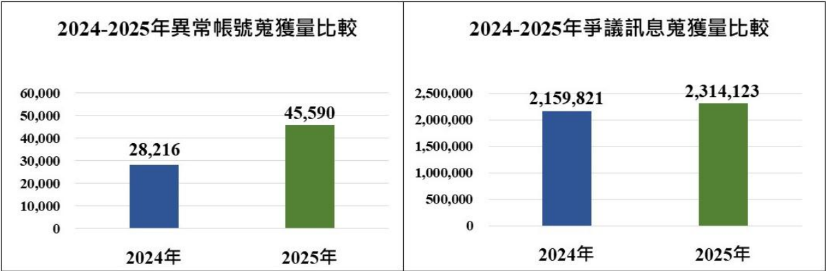
圖 3：2024-2025 年蒐獲異常帳號及爭議訊息數量

中共整合黨、政、軍及民企之資源與技術，全面滲透我國輿論場域，尤其利用 AI 技術提升影音爭訊擬真度，並運用大數據分析，精準且巨量投放爭訊，企圖誤導我公眾認知。2025 年國安情報團隊查報逾 4.5 萬組異常帳號，較 2024 年增加 1.7 萬餘組，並蒐獲逾 231.4 萬則爭訊；全年通報政府相關部門計 3,200 餘則爭訊，俾利政府即時應處中共對我認知戰操作。(如圖 3)